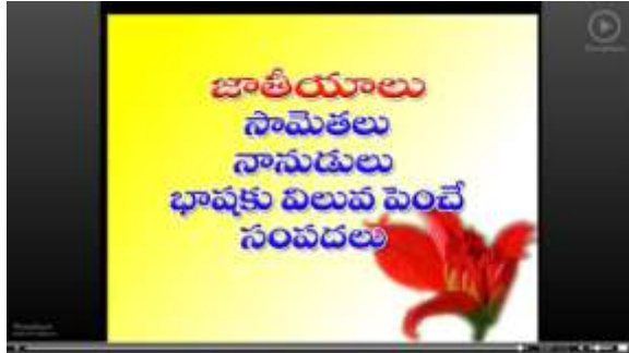
Telugu Grammar (SIET) Content