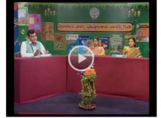
Teacher tools Pedagogy (SIET) Content

T.P. Philosophical Background Hindi A -HM - SIET - AP & TS