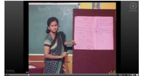
Telugu Video (SIET)