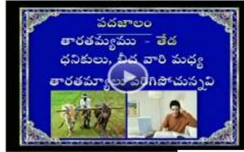
Telugu Grammar (SCERT)

T.P. U6 - U7 శీర్షిక - 2 SCERT - AP & TS