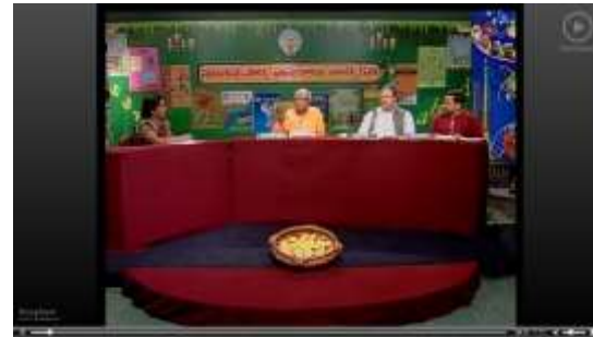
Teacher tools Pedagogy (SIET) Content